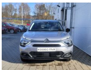
Foto vozu ilustrační s reálnou barvou, Nový vůz, Příplatková výbava v ceně vozu: metalíza