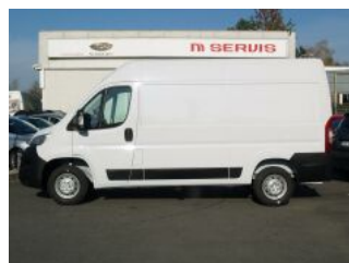
Foto ilustrativní. Údaje, ceny a vyobrazení obsažené v této kartě vozu mají informativní charakter. Toto obchodní sdělení není nabídkou ve smyslu § 1731 nebo § 1732 občanského zákoníku, ani se nejedná o veřejný příslib dle § 1733 občanského zákoníku. Výbava Furgon + rezervní kolo